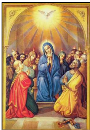
5 giugno : PENTECOSTE