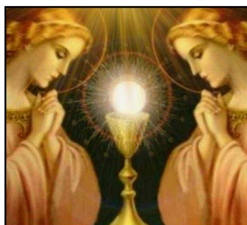
16 giugno : Ss.CORPO E SANGUE DI CRISTO