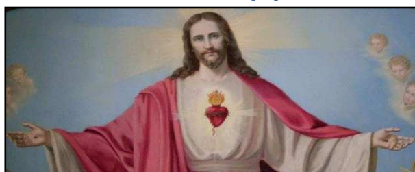
24 giugno : SACRATISSIMO CUORE DI GESU'