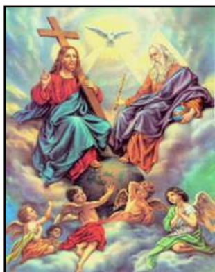
12 giugno : SANTISSIMA TRINITA'