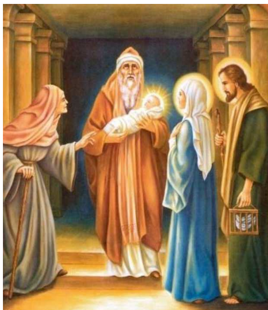
Mercoledì 2 febbraio : PRESENTAZIONE del SIGNORE