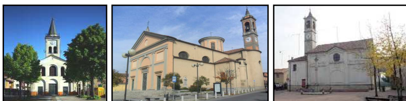
MONCUCCO * CASORATE * PASTURAGO