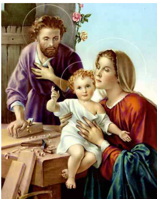
Domenica 30 gennaio : S.FAMIGLIA di GESU, MARIA e GIUSEPPE